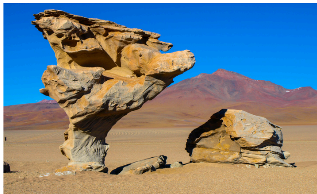
Arbol de Piedra

**LAS OPCIONES DE HOTELES A ELEGIR, SE BRINDAN SEGÚN SOLICITUD