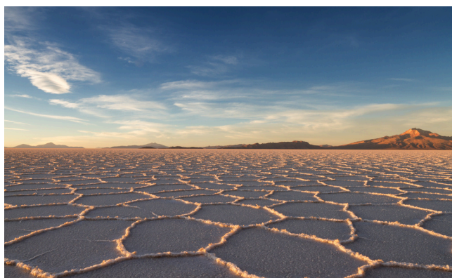
Atardecer en El Salar de Uyuni en temporada seca