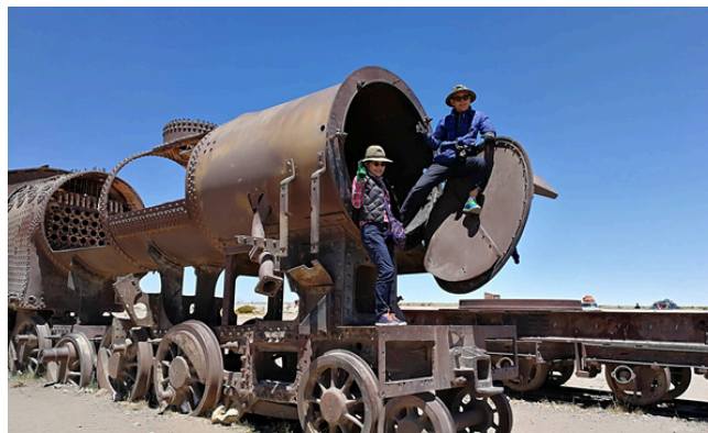
Cementerio de Trenes

En horario conveniente los recogeremos de su hotel su traslado al aeropuerto o terminal de buses. Alimentación: Desayuno a partir de las 07:00